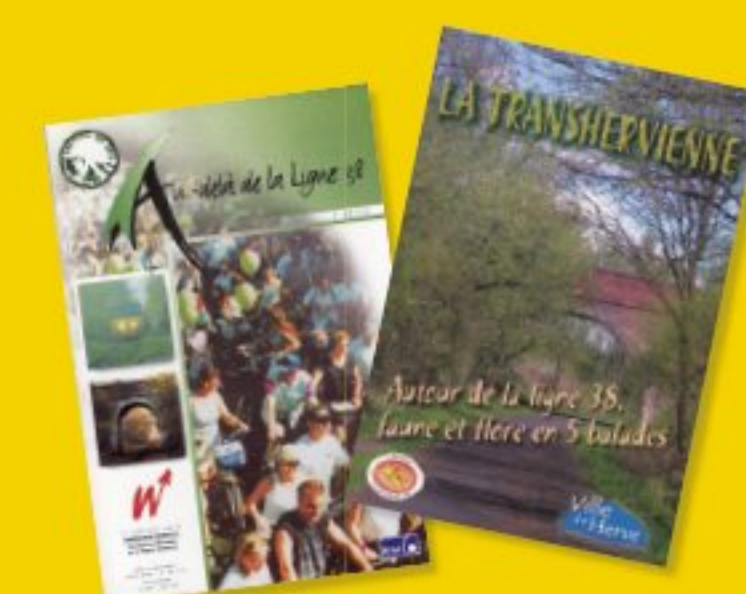
«Au-delà de la Ligne 38» et «La Transhervienne», deux brochures en vente dans les Maisons du Tourisme.